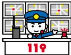
消防指令センターで受信